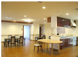
リビング (ユニット)