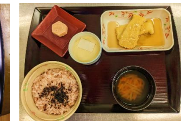
柔らか食例 (天ぷら)