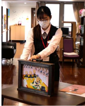
紙芝居読み聞かせ