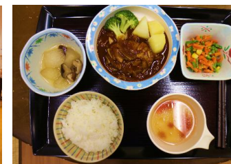
食事例 (煮込みハンバーグ)