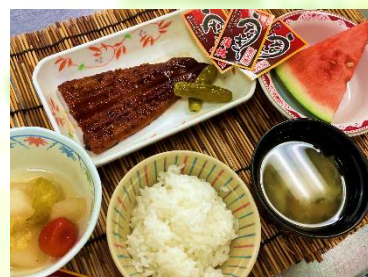
イベント食（土用の丑の日）